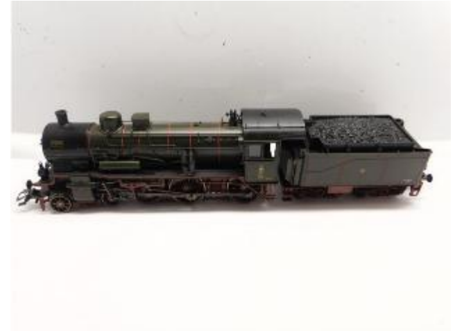
Gehäuse platzieren Mount body Plaats de kap