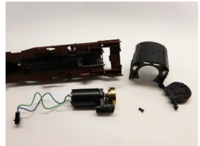
Ausbau alter Motor Take out the old motor Demonteer de oude motor