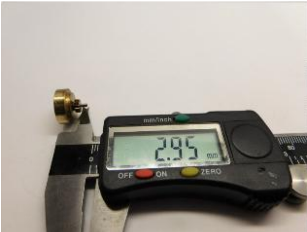
Maße prüfen Check dimensions Controleer de maatvoering