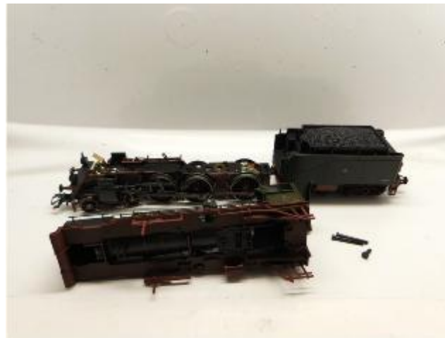
Gehäuse entfernen Remove housing Verwijder de kap