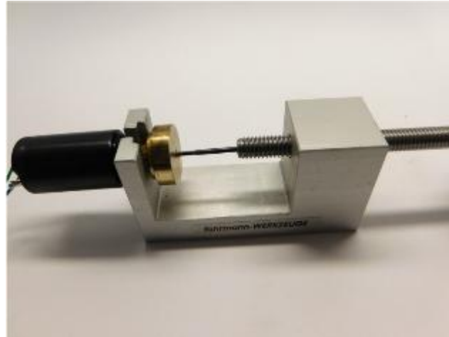
Sie brauchen die Teile wieder You need the parts again Je hebt deze onderdelen wederom nodig