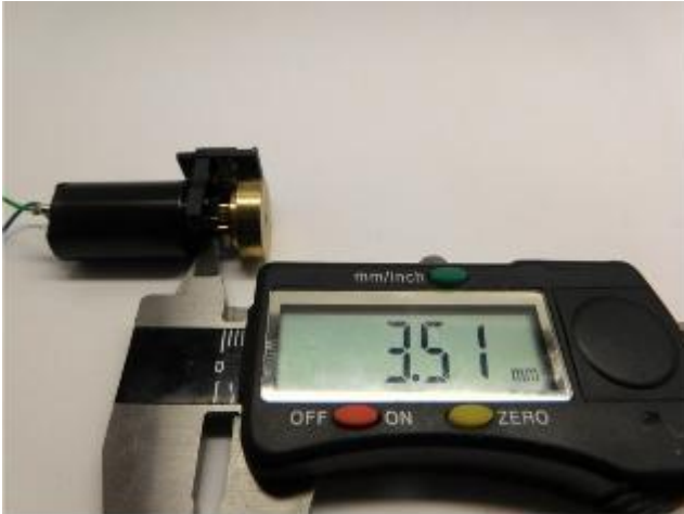
Maße prüfen Check dimensions Controleer de maatvoering