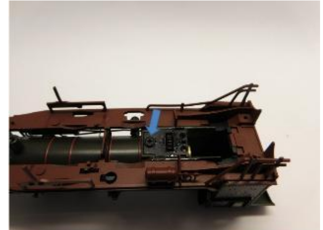
Ausbau alter Motor Take out the old motor Demonteer de oude motor