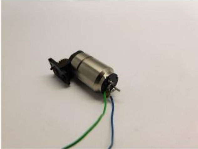
Die Drähte sind verlötet The wires are soldered De draden zijn gesoldeerd