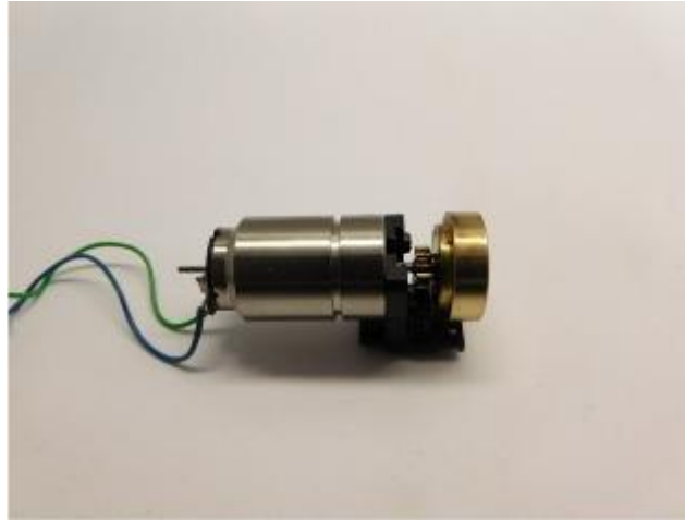
Die Metall Teile sind geklebt The metal parts are glued De metaaldelen zijn verlijmd