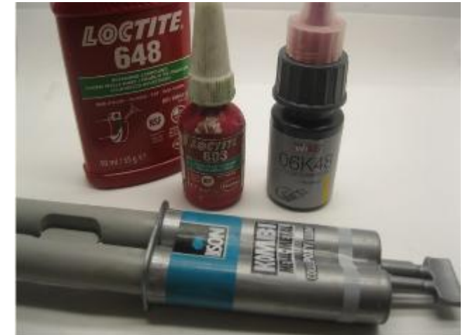
Metallteile werden mit Loctite oder Metal Epoxy Kleber verklebt Metal parts are glued with Loctite or metal epoxy glue Metalen onderdelen worden gelijmd met metaallijm of epoxylijm voor metalen