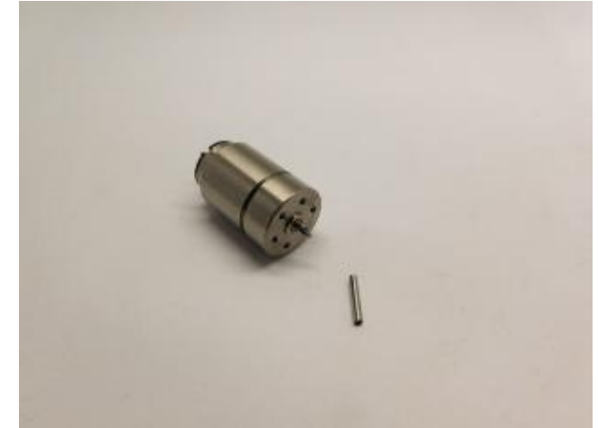
Die Teile des Bausatz Parts of the kit Onderdelen van de ombouwset