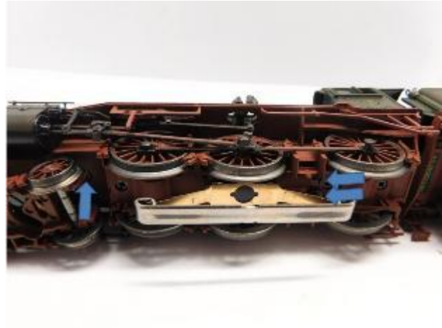
Gehäuse entfernen Remove housing Verwijder de kap