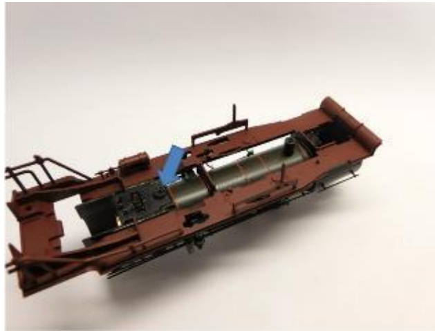
Motor platzieren Place the motor Plaats de moto