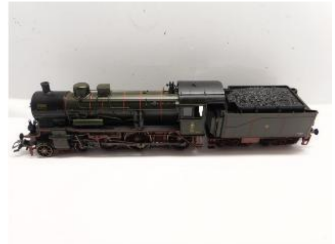
Umbau fertig Upgrade complete Ombouw gereed