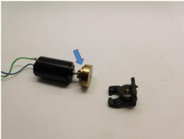
Sie brauchen die Teile wieder You need the parts again Je hebt deze onderdelen wederom nodig